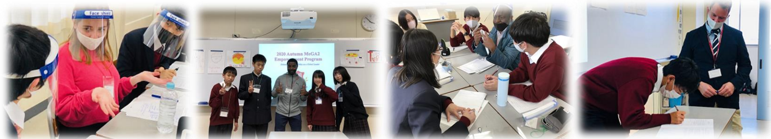
※これまでのプログラムの様子