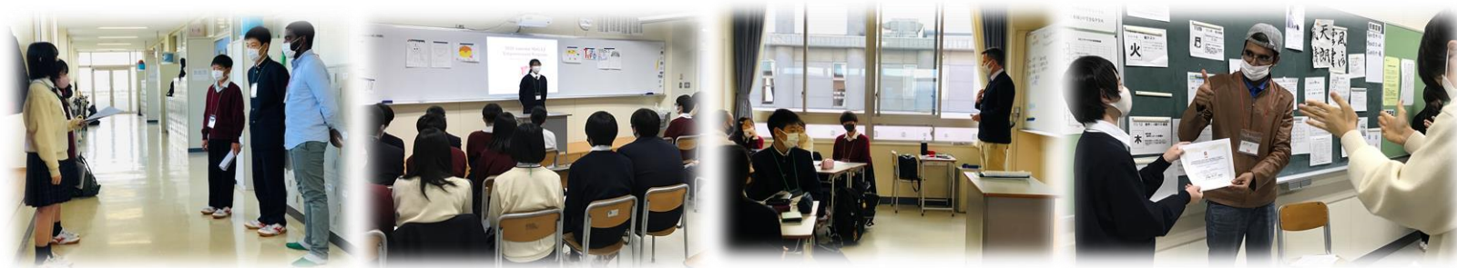
※これまでのプログラムの様子